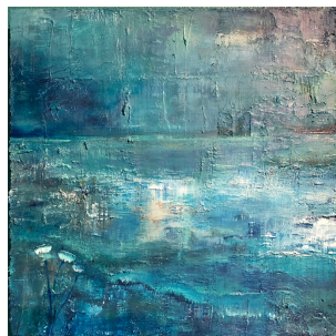
Catherine Trudel Peintures